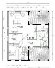
Plan rez de chaussée échelle : 1/100