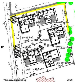
Plan rez de chaussée échelle : 1/100